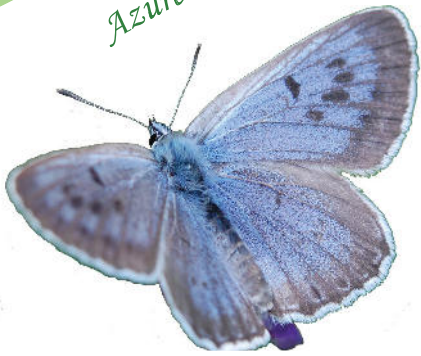
Azuré du serpolet